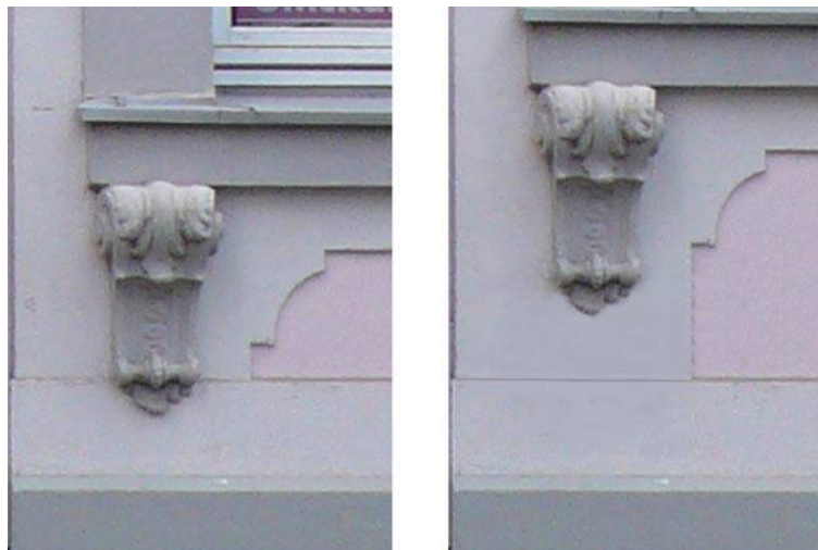
Abb. 3: die Konsolen unter den Erdgeschoss-Fenstern; links der Bestand, rechts die Planung gemäß der veröffentlichten Zeichnung. (Bildmontage: C. Presche; vgl. http://www.presche-chr.de/christian/Koenigsplatz%2055-Dateien/image064.jpg )

Besonders fatal wirkt sich die Streckung der Brüstungszonen aus: Während im historischen Zustand die unteren Fensterkonsolen passgenau zwischen dem Sockelabsatz und dem Fenstersims vermittelten, hängen sie nun gewissermaßen in der Luft und verlieren damit ihren ursprünglichen Zusammenhang (man beachte, dass die frei hängenden Konsolen im Geschoss darüber bewusst ganz anders ausgebildet waren). Zudem bleibt ein Rätsel, wie am untersten Ansatz nun mit dem Fehlen des Sockelvorsprungs umgegangen werden soll.