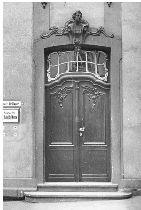
Abb. 2: südl. Nebeneingang

Deutlich werden diese Veränderungen auch am südlichen Nebeneingang, der zwar in Anlehnung an das Original wiederhergestellt werden soll, ursprünglich aber kein zusätzliches Oberlicht benötigte, sondern analog zu den übrigen Fenstern abschloss. Die fein abgestimmte Hierarchie zwischen Haupt- und Nebeneingang geht damit verloren.